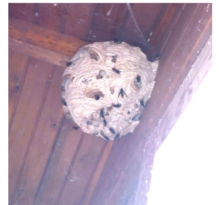
Nid secondaire, de la taille d'un ballon de basket

Si vous observez des nids de frelons asiatiques mettez-vous en relation avec la Mairie, ou contactez l'association via contact@natureescaut.org ou sur sa page facebook.