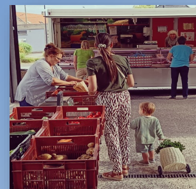
Marché du Village