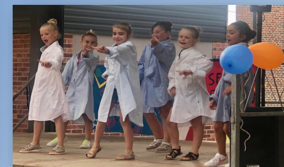
Fête du Centre