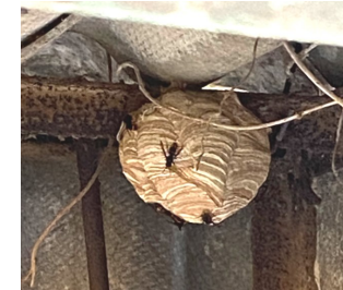
Nid primaire, de la taille d'un melon

veiller sur des pièges sélectifs que l'association mettra à leur disposition. Ils participeront à une formation et s'engageront à participer à notre réseau de vigilance d'une douzaine d'acteurs avec les communes voisines.