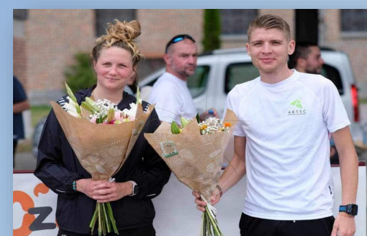
Premiers arrivés de « la Castellabienne »